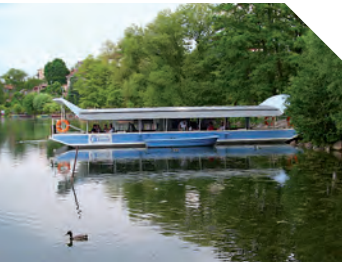
Die Fähre in Strausberg