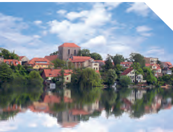
Blick auf Strausberg