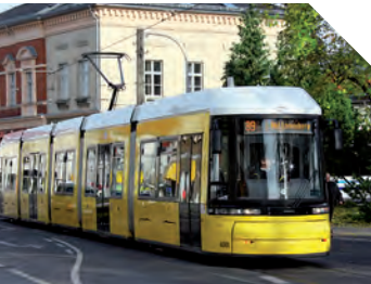
Die Flexity-Tram am Lustgarten