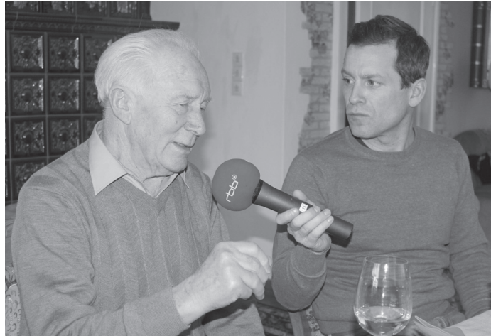
Anlässlich des 80. Geburtstages besuchten Sigmund Jähn nicht nur zahlreiche Gratulanten, sondern auch einige Reporter.

mit glänzenden Augen von seiner Reise ins Weltall erzählt. Mit ihnen feierte