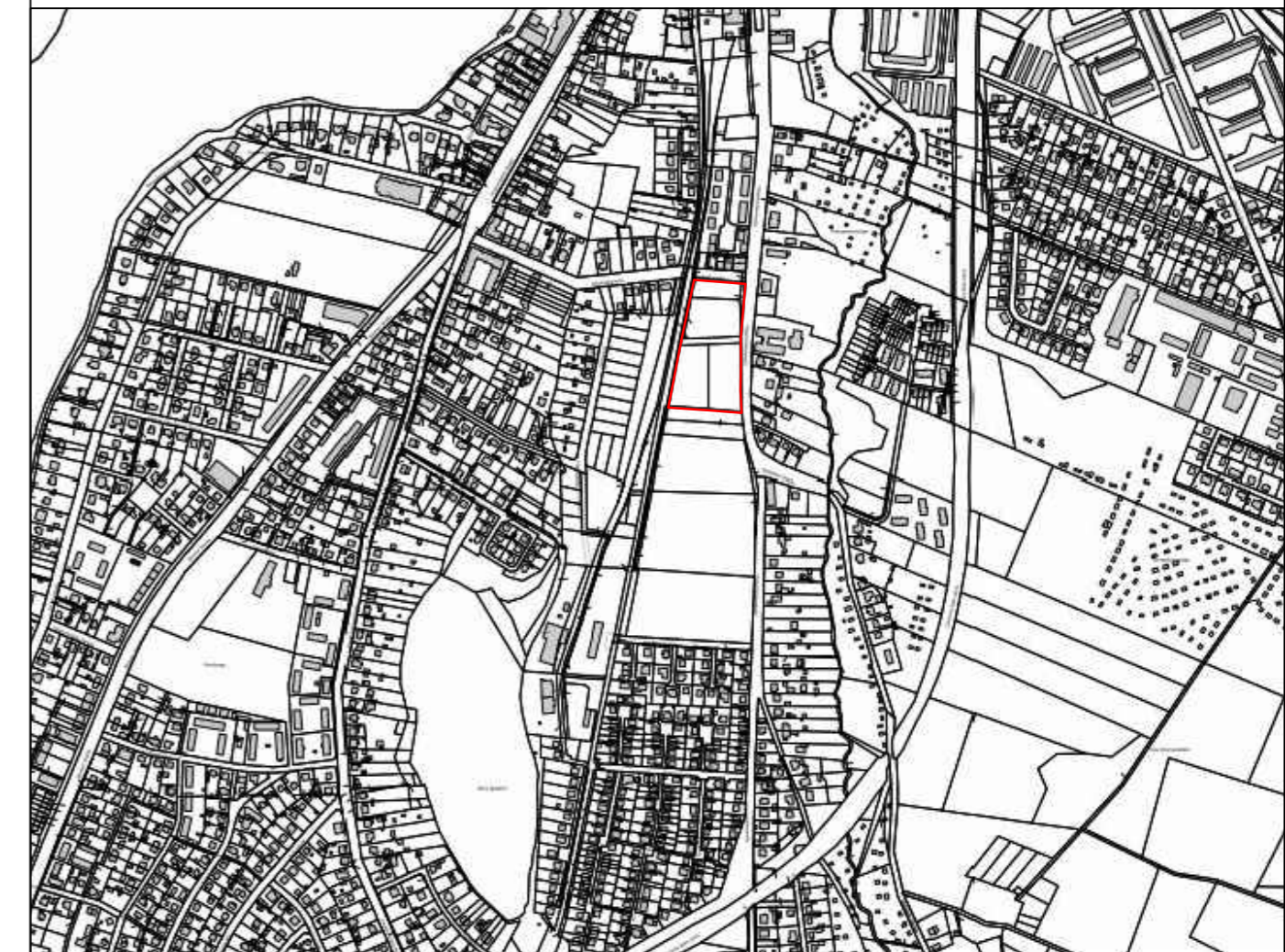
Übersichtsplan (ohne Maßstab)