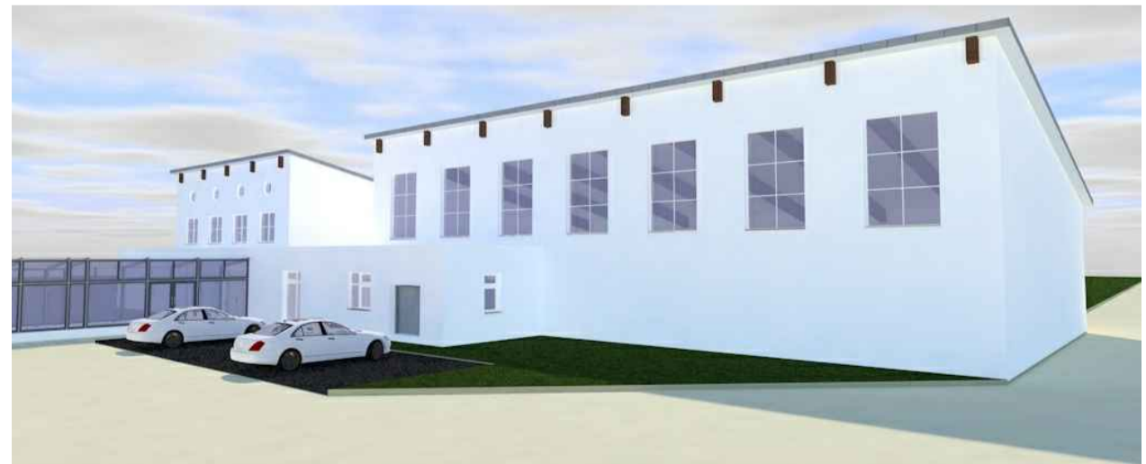
Beispielhafte Modellierung der Sporthalle