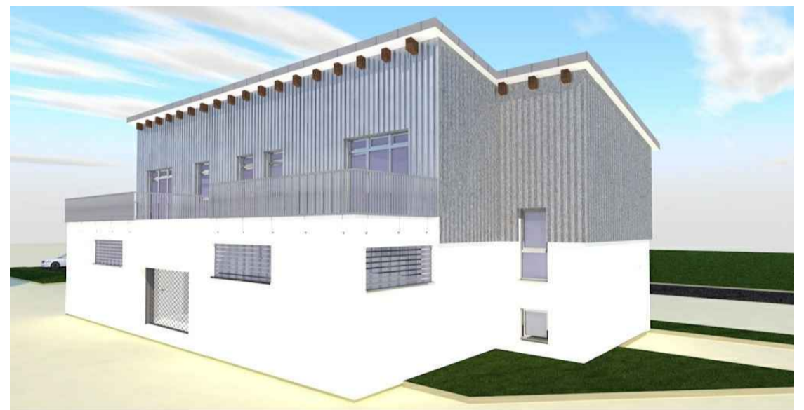
Beispielhafte Modellierung der Wirtschaftsgarage