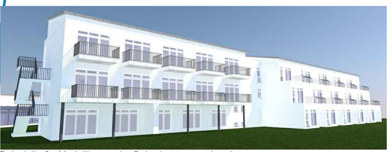
Beispielhafte Modellierung der Beherbergungsgebäude