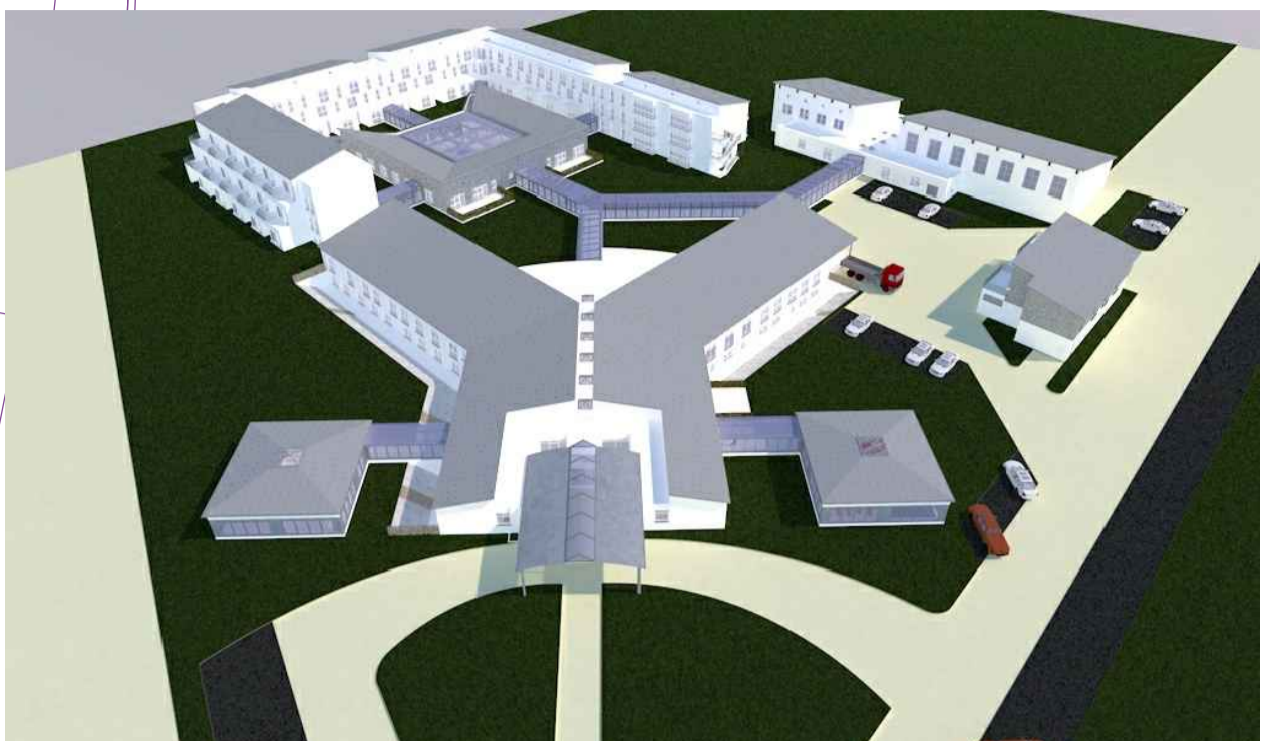
Beispielhafte Modellierung des Klinikensembles (Vogelperspektive)