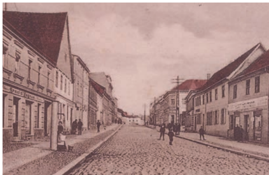
Wohl wenige erinnern sich noch, dass die Stadt-Apotheke bis 1978 in der Großen Straße (neben dem heutigen Whisky House) ansässig war, bevor der Umzug zum heutigen Markt 1 folgte.

sich die Stadt-Apotheke mit ihren Filialen, der Apotheke am Landsberger Tor und der Annatal-Apotheke im Ambulatorium Hegermühle, für die nächsten erfolgreichen 300 Jahre getreu ihrem Motto: „Gemeinsam für Ihre Gesundheit“!