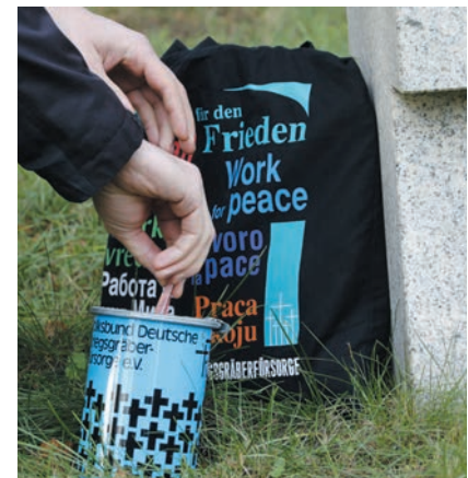
Markant: Die Spendendosen der Kriegsgräberfürsorge.

Neben der Haus- und Straßensammlung, die natürlich unter Einhaltung der geltenden Hygiene- und Abstandsregeln erfolgt, gibt es auch eine digitale Spendendose ( https://www.volksbund.de/sammlung ).