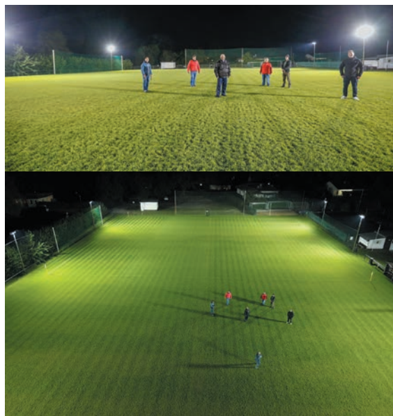
Vorstandsmitglieder und ausführende Elektriker testen die neue Beleuchtung.

Mit als erste konnten sich die B-Junioren von der neuen Anlage überzeugen, trainieren sie doch meist erst ab 19 Uhr. Nach dem Hybrid-Rasen, der 2018 installiert wurde, ist es die nächste Neuerung, auf die Vereinsmitglieder und Sportfreunde zurecht stolz sein können.