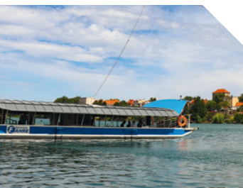
Unterwegs mit der Straussee-Fähre