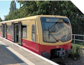
Die S5 in Strausberg Nord