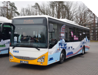
PlusBus nach Bad Freienwalde

Strausberg bietet zahlreiche öffentliche Verkehrsmittel. Folgende ausgewählte Linien möchten wir Ihnen näher vorstellen: