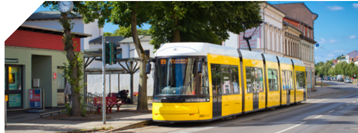
Die Tram 89 vom Lustgarten Richtung S-Bahnhof Strausberg

Die Tramlinie 89 verkehrt ab Strausberg Bahnhof im Anschluss von und zur S5 in Richtung Strausberger Innenstadt zur dortigen Endhaltestelle